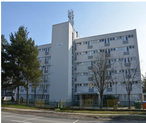
Spojená škola, Rosinska cesta, Žilina - Internát