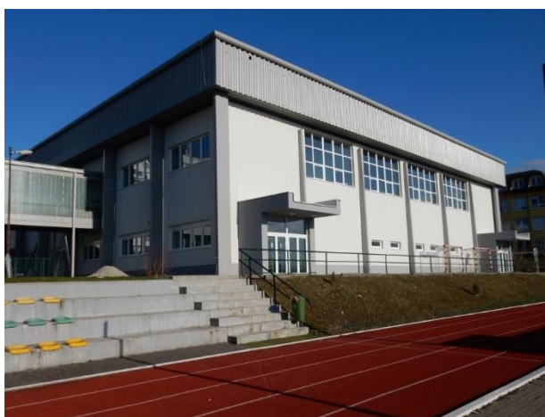
Športová hala pri Spojenej škole, Rosinská cesta, Žilina